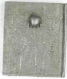
東野芳明《セルフ・ポートレート》1975年 個人蔵