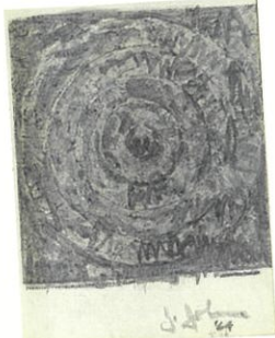
ジャスパー・ジョーンズ 《塗りつぶされた白い旗》1964-1966年 富山県美術館蔵(東野芳明旧蔵)