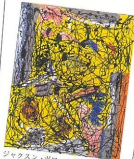
ジャクソン・ポロック《無題》1946年 富山県美術館蔵

会期 2025年1月25日(土) ~ 4月6日(日) 開館時間 9時30分 ~ 18時(入館は17時30分まで) 休館日 毎週水曜日、2月25日(火) 会場 富山県美術館 展示室2、3、4