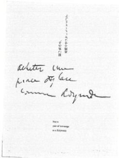
東野芳明《According to Marcel #1》 1974年 個人蔵