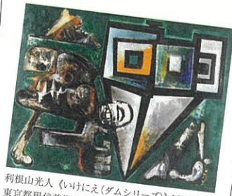
利根山光人《いけにえ(ダムシリーズ)》1956年 東京都現代美術館蔵