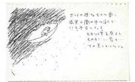
1 イメージスケッチ「ハウ・ハイ・ザ・ムーン」1980年代 クラマタデザイン事務所蔵 / 2 倉俣史朗 1990年 / 3 《ピラミッドの家具》1968年 株式会社イシマル蔵 / 4 《ハウ・ハイ・ザ・ムーン》1986年 富山県美術館蔵 / 5 ショップ「スパイラル」1990年 / 6 スケッチブック「言葉 夢 記憶」より 1980年代 クラマタデザイン事務所蔵

会 期 2024年2月17日(土)~4月7日(日) 開館時間 9:30~18:00(入館は17:30まで) 休 館 日 毎週水曜日(3/20開館、3/21休館) 会 場 富山県美術館 展示室3、4