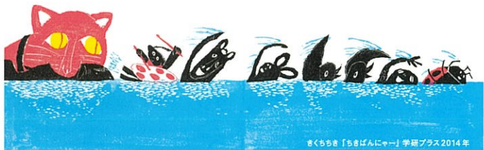
まぐちちき「ちきばんにゃー」学研プラス2014年