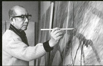
第二期障壁画《揚州蒸風》を制作中の東山魁夷

会 期 2021年9月18日(土) - 11月7日(日) [前期]9月18日(土) - 10月12日(火) [後期]10月14日(木) - 11月7日(日) 開館時間 9:30 - 18:00 (入館は17:30まで) 休館日 毎週水曜日(11月3日は開館)、9月21日(火)・11月4日(木) 会場 富山県美術館 展示室2、3、4