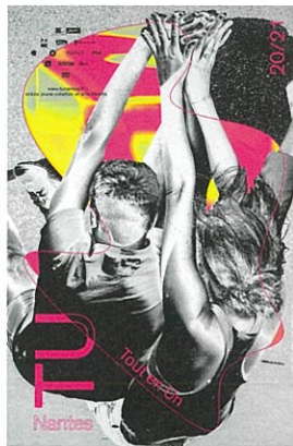
スーパーテラン (フランス) 〈あなたとナント市 シーズン2020-2021〉2020年 Super Terrain / Tu - Nantes, season 20/21