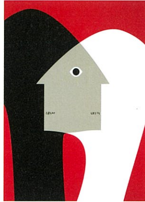
ヘ・ファン (中国) 〈一つになること〉2020年 He Huang / Unity

世界ポスタートリエナーレトヤマ (IPT) は、世界から最新のポスターを公募し、審査・選抜する、日本で唯一の国際公募展です。1985年の創設以来、3年に1度のトリエンナーレ方式で開催を続けるなかで、現在では世界的に注目される公募展に数えられています。13回目を迎える公募には、世界64の国と地域より全部門総計5,943点のポスターが寄せられました。また、前回から設けた若手対象のデータ応募の部門を「U30+STUDENT部門」とし、公募対象を30才以上の学生まで広げました。本展では、全応募作品から選ばれた入選・受賞作品に、審査員による招待作品を加えた約400点により、世界の最先端をゆくポスターデザインを紹介します。