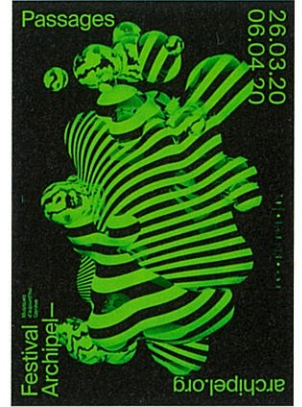
ソフィー・ルービン、セドリック・ロッセル (スイス) 〈フェスティバル・アルシペル 2020〉2020年 Sophie Rubin, Cedric Rossel / Festival Archipel 2020