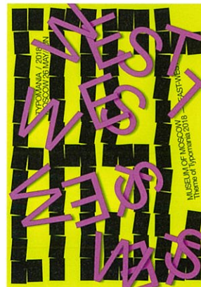
ヘシャム・セイフ (エジプト) 〈東-西〉2018年 Hesham Seif / EAST-WEST