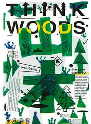
チェン・ヤンティン (台湾) 〈森を思う〉2020年 Chen Yanting / Think Woods