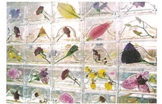
薔薇の箱、レストランのためのショウケース

12月14日(土) 13:00-16:00 ●会場: 3階アトリエ ●対象: 小学生以上(定員20名) 「カセットプラント」は、透明なカセットケースの中に一輪の花や木の葉など植物を樹脂で“封印”して つくります。それら1個1個を組み合わせて大きな作品をつくり、完成作品は美術館内に展示します。 ※植物は乾燥処理された特別な素材を使います。