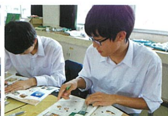
制作授業風景(左:宮野小学校 右:富山西高等学校)