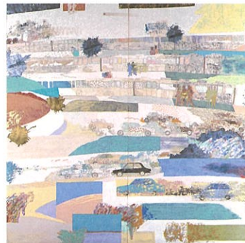
尾長良範《scene》1988年 東京都現代美術館蔵