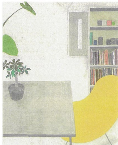
尾長良範《zone》2020年 作家蔵