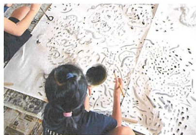
ワークショップの様子(2021年7月26日開催)