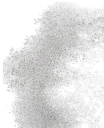
尾長良範《zone》2008年 作家蔵