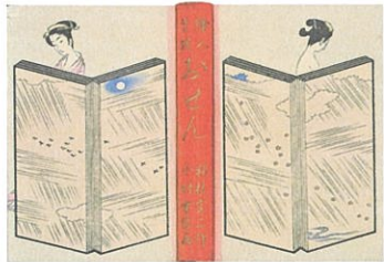
邦枝完二『繪入草紙 おせん』(表紙) 装幀=小村雪岱 1934年 清水三年坂美術館蔵