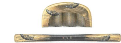
銘「松山(印形)《柴舟時絵櫛・弁》明治~昭和時代・20世紀 個人蔵