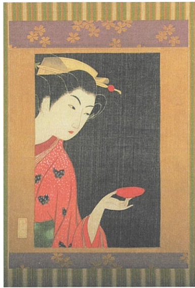
小村雪岱《盃を持つ女》清水三年坂美術館蔵