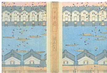
泉鏡花『日本橋』(表紙) 装幀=小村雪岱 1914年 清水三年坂美術館蔵