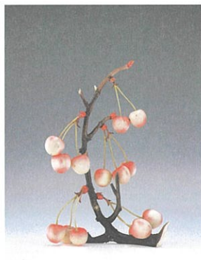
高木芳真《桜桃牙彫置物》 大正~昭和時代・20世紀 清水三年坂美術館蔵