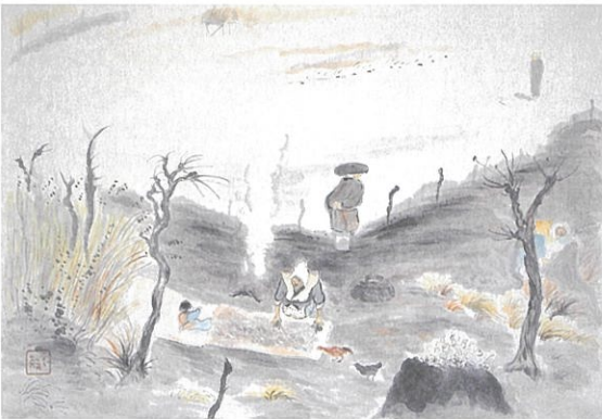
小川芋銭《沼》制作年不詳 全て富山県水墨美術館蔵