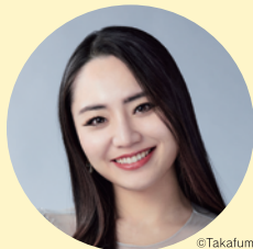
高野百合絵 ソプラノ