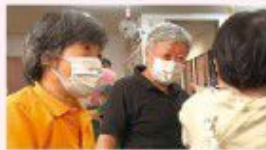
富山市「このゆびとーまれ」

UPつぷ富山きとラボ 困ったらここに来られ! ~「富山型テイサービス」の30年~ (上映時間 27分)