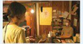
高岡市伏木「なるや」