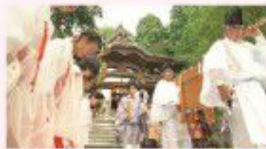
第21回 庄川弁財天社三十三年式年御開扉大祭