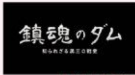
黒部峡谷「黒三ダム」

KNBふるさとスペシャル 鎮魂のダム 知られざる黒三の戦史 (上映時間 47分)