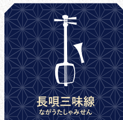
長唄三味線 ながうたしやみせん

平家物語などの古典曲はもちろん、童話や民話、落語を元に新作の語り作品を創作、自演もしている。アニメ・テレビ音楽の録音、劇中音楽への参加、器楽としてのアンサンブル演奏まで活動は多岐にわたる。国外オーケストラと武満徹作品のソリストとして共演するなど、国外での活動も多数。2019年琵琶楽コンクール第一位。文部科学大臣賞。